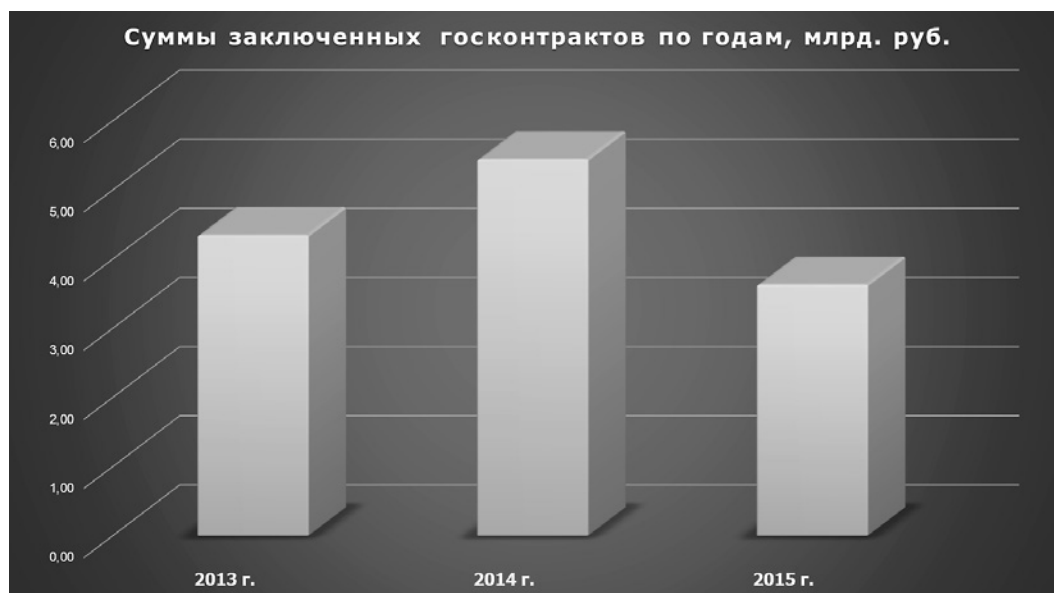
Рис. 1. Суммы заключенных государственных контрактов на поставку ПО и услуг по информатизации здравоохранения в 2013–2015 гг.

Распределение сумм заключенных государственных контрактов по видам конкурсных процедур представлено на рис. 2 . Как видно, подавляющее большинство КП (60%) проводится в форме открытого аукциона. Второй по популярности вариант проведения госзакупки – проведение открытого конкурса.