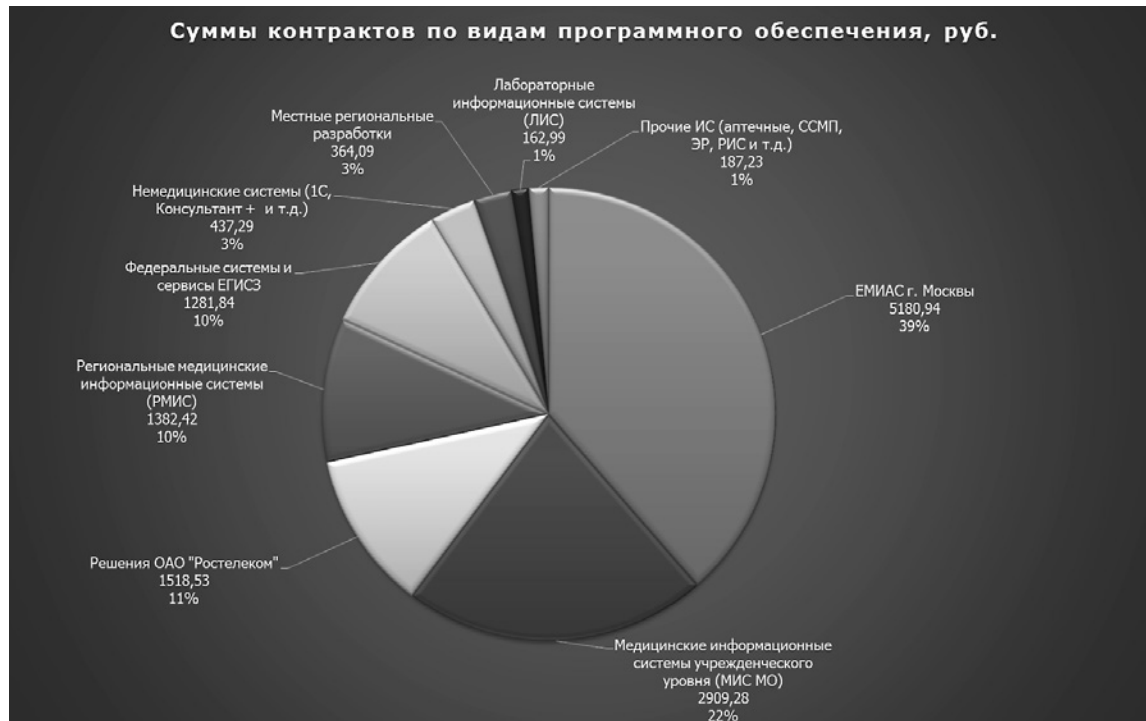
Рис. 5. Суммы заключенных государственных контрактов по видам программного обеспечения за 2013–2015 гг.

В 2015 г. на рынке стали более активно влиять сокращения бюджетов и осторожность государственных заказчиков в плане финансирования проектов информатизации здравоохранения, и поэтому по многим из разработчиков мы видим сокращение сумм заключенных государственных контрактов. В сложном 2015 г. свои показатели удалось улучшить только «Самсон Групп» (вероятно, стала приносить свои плоды особая стратегия этой компании по использованию СПО и бесплатной первоначальной поставки продуктов), «Алькона» (компания преимущественно занимается развитием сегмента ЕГИСЗ в Чувашии), Сп.АРМ и К-МИС. У остальных разработчиков мы видим заметное снижение показателей заключенных госконтрактов.