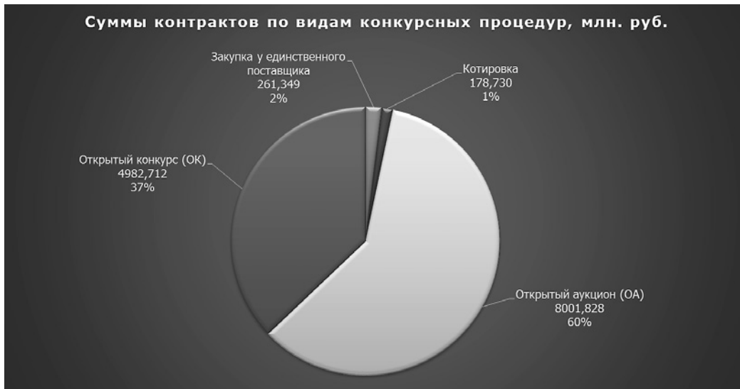
Рис. 2. Суммы заключенных государственных контрактов по видам конкурсных процедур за 2013–2015 гг.

Финансирование конкурсных процедур на развитие проектов информатизации выполнялось из различных источников. Распределение их представлено на рис. 3.