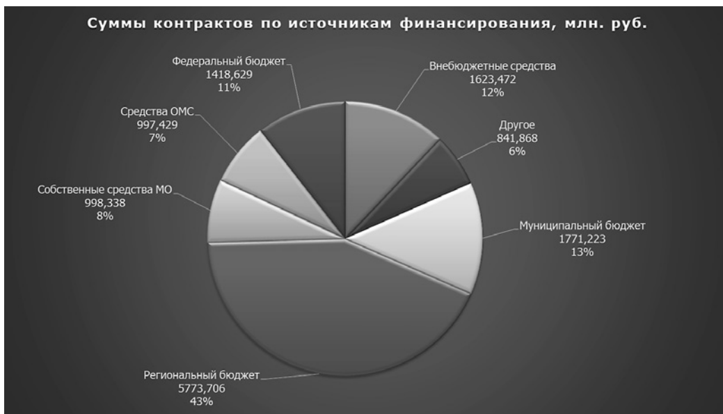
Рис. 3. Суммы заключенных государственных контрактов по источникам финансирования за 2013–2015 гг.

Как видно из рис. 3, главным источником финансирования проектов в области информатизации здравоохранения на сегодняшний день являются региональные бюджеты – доля